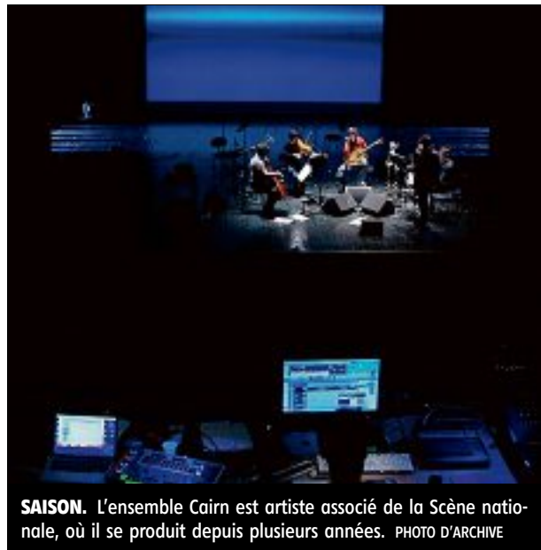
SAISON. L'ensemble Cairn est artiste associé de la Scène nationale, où il se produit depuis plusieurs années.