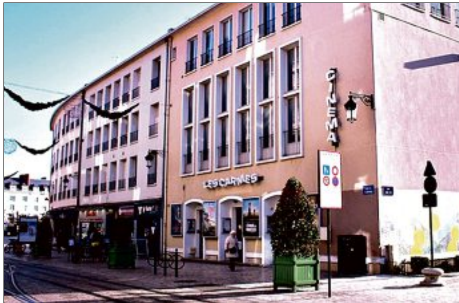
GÉRANT. Depuis son arrivée fin 2013, le cinéma a investi 700.000 € dans ses locaux.

Depuis sa reprise en novembre 2013, l'équipe du cinéma indépendant enregistre une hausse de fréquentation constante. « De 124.000 spectateurs en 2013, on est passé à 160.000 en 2017 », souligne le gérant qui souhaite continuer à ouvrir son cinéma à d'autres publics et à diversifier son offre. « D'après le Centre national du cinéma (CNC), avec leurs trois salles, Les Carmes proposent 30 % de l'offre cinématographique à Orléans. Mais surtout,