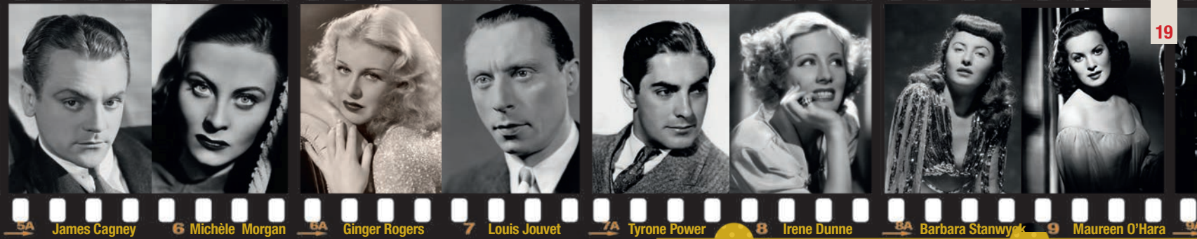
5A James Cagney